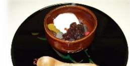
クリームあんみつ