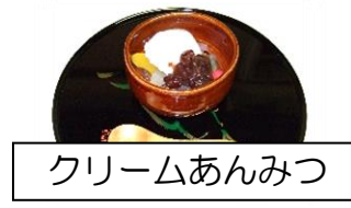
クリームあんみつ