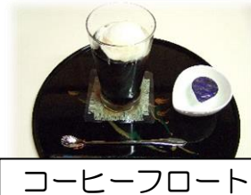
コーヒーフロート