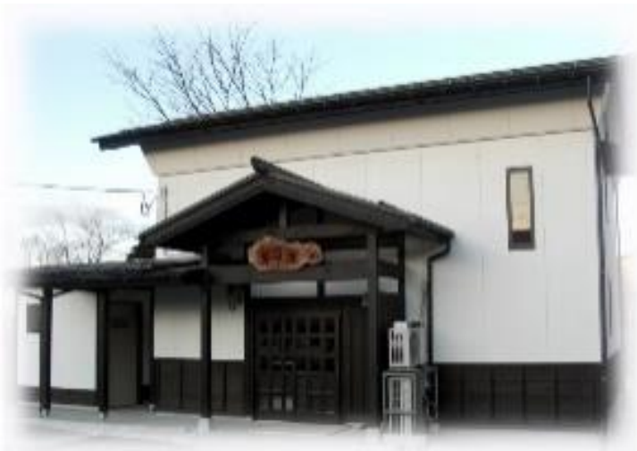
【ふれあいサロン 芽咲庵（店内1階）】