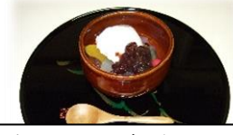
クリームあんみつ