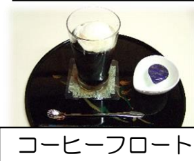
コーヒーフロート