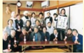
<いきいきサロンの様子>

※福祉会の活動は「少しの気配り」「少しのお手伝い」という一人ひとりの優しい気持ちが出発点です。地域の住民の参加協力による、手助けや声かけ、見守りといった活動を日常的に行うことによって、安心して暮らすことができる地域社会をつくらうとする住民の活動です。