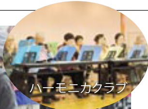
ハーモニカクラブ