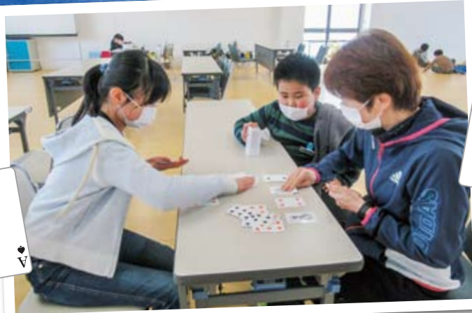
西小千谷学童クラブ そよかせ

春休み、4月～新1年生も加わり、市内10カ所の学童クラブで笑い声が響き渡りました。新型コロナウイルス感染症予防のためマスクを着用してゲーム、工作、音楽、運動と子供たちは元気に活動をしています。