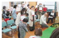
町民みんなでゲーム大会