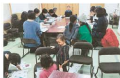
地域づくり対話会の様子