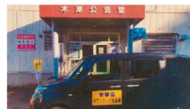
買い物送迎サービスを試行しました