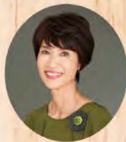
代表 中井 貴恵 さん (俳優・エッセイスト)