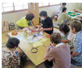
ふれあいいいきサロン