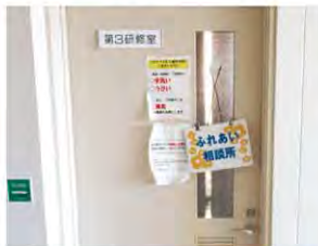
ふれあい福祉センター相談所 (入口)