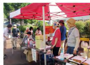
さつきふれあい祭り