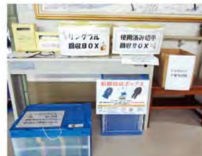
フードドライブ設置場所