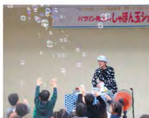
こんすけ基金事業「シャボン玉ショー」