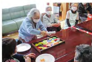
デイホームだんらん