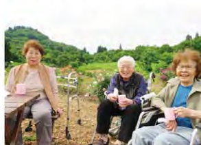
デイサービス外出行事