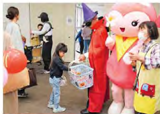
福祉ふれあいフェスティバル