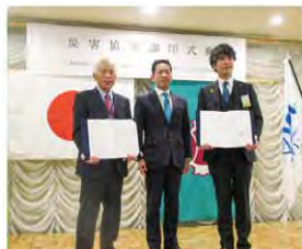
青年会議所との災害時支援協定締結