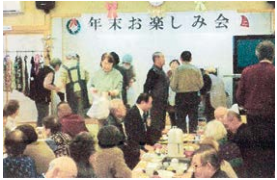
多くの住民が集いました

真人町里地福祉会は12月11日に年末お楽しみ会を開催しました。約70名の参加があった中、駐在所長の講話や町民有志によるアトラクションや抽選会等により、地域住民同士のつながりがより一層強くなりました。