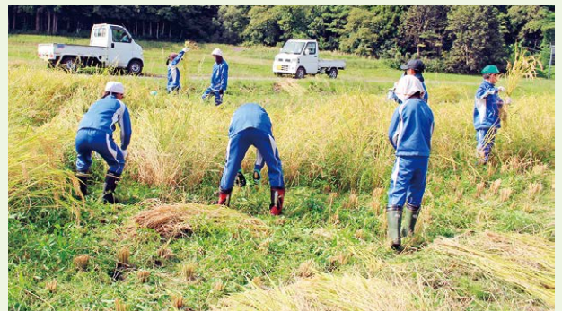
「あいおこめ」収穫の様子です