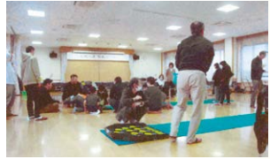
楽しいスカットボール大会

片貝町一之町二区町内会は、12月1日に町民のつどいを開催しました。町民約70名が集まりスカットボール大会や抽選会、懇親会等を楽しむことで、町民間のつながりを深め意義のある「つどい」となりました。