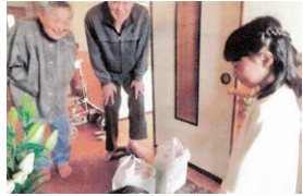
子どもたちの訪問による交流会

池ヶ原絆の会は地域助け合い活動として、11月17日に地域の小・中学生と絆の会会員と一緒に高齢者宅の友愛訪問を実施、日頃なかなか顔を合わせる機会の少ない世代同士の交流につながりました。