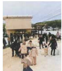
雪上での遊びを楽しみました

桂町内会は、1月12日にさいの神における町民交流イベント「雪上レクリエーション大会」を開催、町民約200名が雪上での様々なゲームを通じ世代間交流を行いました。会場では声援や笑い声が飛び交い、ゲームを楽しみながら子どもから高齢者まで親睦を深めました。