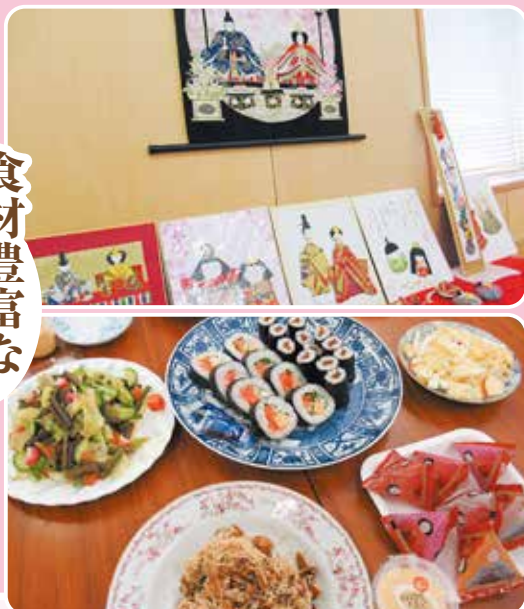
食材豊富な ご飯を食べて