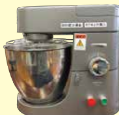
卓上ミキサー(クッキー用)

この度、BSN様の「令和6年度BSN愛の募金助成」にさつき工房が選ばれました。いただいた助成金につきましては、日頃から製作しているオリジナル製品の備品購入に活用させていただきました。ありがとうございました。