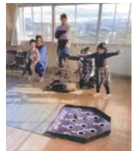
スカットボールで子どもも大喜び

茶畑町内会は、1月26日に世代間交流事業として「新年顔合わせ会」を開催しました。子どもから高齢者まで幅広い世代が一堂に会した中、ゲーム大会や餅まき、大道芸人のパフォーマンス等を通じ楽しい時間を過ごすことで、町民同士の融和と懇親が深められました。