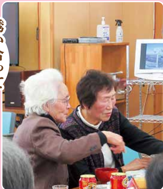
誘い合って 話して